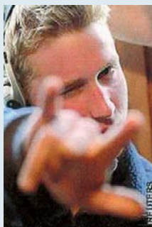
Prince William signalerar ett sataniskt tecken

frimurargraden. Denna 13:e illuminatigrad gör anspråk på att de har både Heliga Jesu Blod och blod eller frö av satan i sina ådror. Frimurarorden och Illuminati är sannolikt också engagerade i upplägget både med The Holy Blood and the Holy Grail , en fackbok som publicerades 1982, och senare även med Dan Browns DaVinci-koden . Båda dessa alster är i själva verket en desinformationskampanj för att förbereda och direkt bedra världen om en blodslinje mellan Jesus Kristus och den kommande antikrist. Med denna historiska bakgrund kan vi också ana att både Windsor- och Stuart släktena är starkt förbundna med ockultism i allmänhet.