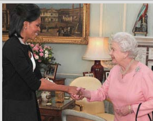
Drottning Elizabeth II hälsar First Lady Michelle Obama med frimurarhandslag vid hennes första officiella besök i London

Det Brittiska Kungahuset är tätt förknippat med frimurarverksamhet och The Most Noble Order of the Garter (Strumpebandsorden). The Most Noble Order of the Garter är den överordnade organisationen över alla frimurarloger i hela världen. När en man blir den 33:e gradens Mason, svär han trohet till denna organisation och därmed till prins Charles. Den 23 april 2008 invaldes Prince William som den 1000:e medlemmen i organisationen. Det Brittiska Kungahuset har också varit viktiga galjonsfigurer då det gällt att skapa trovärdighet och respekt för den brittiska frimurarorden i allmänhet. Det brittiska frimurarväsendet har på så vis lyckats hålla sig fria från mycket av den kritik som de övriga nationella frimurarnas grupper har drabbats av.