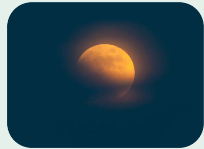
Oxförmörkelsen 15 juni 2011. Bilden från Sicilien

I två tidigare artiklar har vi studerat Oxförmörkelserna och " Bull's-Eye Blood Moons " över Jerusalem . Det är att rekommendera att man först skaffar sig en insyn i dessa artiklar innan man går vidare i denna text. Vi skall nu fortsätta med att ge en fördjupad bild över Krabbförmörkelserna och dess profetiska tecken. Både Ox- och Krabbförmörkelserna rymmer var sin "Bull's-Eye Blood Moon" över Jerusalem vilka båda uppträder som den andra och mellersta i förmörkelsetripplarna. I Oxförmörkelserna ägde den rum 15 juni 2011 och i de kommande Krabbförmörkelserna sker det den 27 juli 2018, den senare en profetiskt mycket intressant förmörkelse som vi återkommer till längre fram.