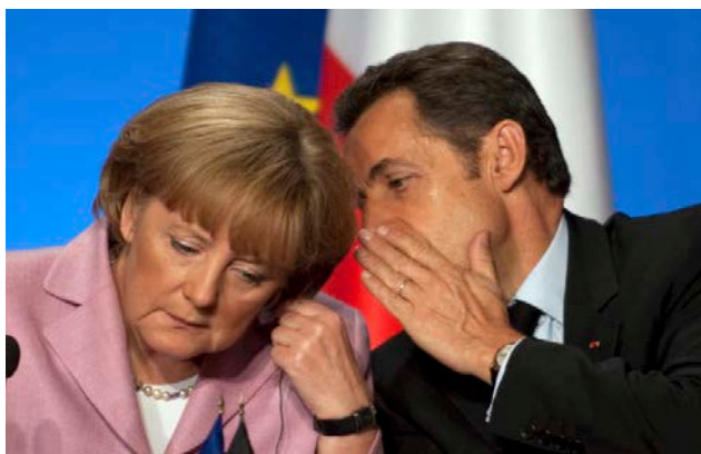
Dryftas en dold agenda?

Vad är då den dolda agendan för en mer permanent omstrukturering? Ja det verkar stå klart att det är Tyskland och Frankrike som är drivande i detta projekt. Merkel och Sarkozy har under senaste tiden haft mycket täta kontakter och man har sannolikt dryftat betydligt mer substantiella frågor än vad som kommit ut i pressmeddelanden. Rykten gör gällande att Tyskland och Frankrike vill skapa ett nytt euroområde som i grunden kommer att förändra Europas framtid. En artikel i The Telegraph hävdade nyligen att Frankrike håller på att utarbeta planer för att åstadkomma en utbrytning av euroländer, en utbrytning som vill skapa sitt eget fördrag, parlament och huvudkontor - ett drag som i realiteten skulle underminera den nuvarande Europeiska unionen.