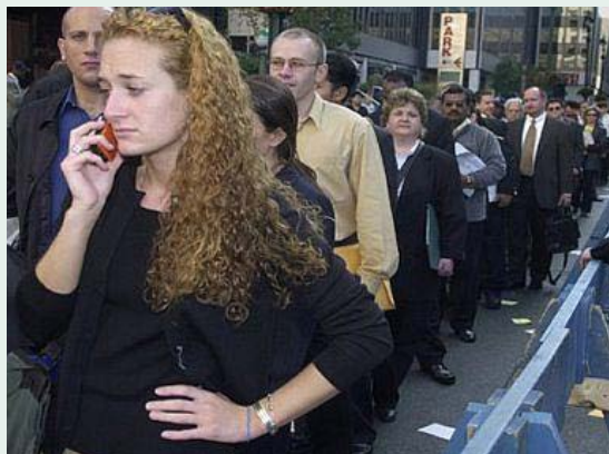
Kön av arbetssökande amerikaner syns oändlig

Andra oroväckande siffror är att USA har förlorat ett genomsnitt på 50 000 industrijobb per månad efter Kinas anslutning till Världshandelsorganisationen 2001. Detta har fått till följd att medelinkomstjobben minskar och hälften av alla arbetande amerikaner tjänar nu 505 dollar eller mindre per vecka (en månadslön motsvarande cirka 13 200:- SEK). Färsk augustistatistik från The Bureau of Labor Statistic (BLS) visar att den reala timlönen under perioden juli 2010 till juli 2011 minskade med 1,3 procent. Nya siffror visar också att 6 procent av de 72,9 miljoner amerikaner som lyfter lön som timanställda fick en lön som var på eller under den federala normen på 7,25 dollar. Detta är en ökning från 2009-års siffra på 4,9 procent. Samtidigt svarar nu USA:s rikaste 5 procent av befolkningen för 37 procent av konsumtionen.