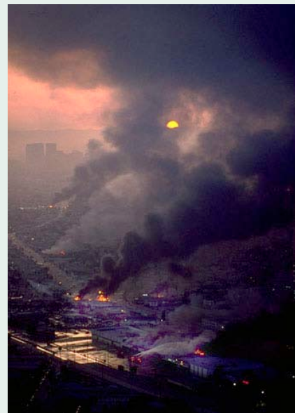
Bilden visar kravallerna i Los Angeles 1992

Juli månads arbetslöshetssiffror från BLS pekar på att 9,1 procent av den amerikanska arbetskraften idag är arbetslös vilket motsvarar 13,9 miljoner. 44 procent av dessa har stått utan arbete i sex månader eller mer. USA:s regering har under senare tid från flera håll fått motta kritik för sättet att räkna. National Inflation Association (NIA) hävdar att regeringen manipulerar arbetslöshetsstatistiken och att arbetslösheten i själva verket är betydligt högre.