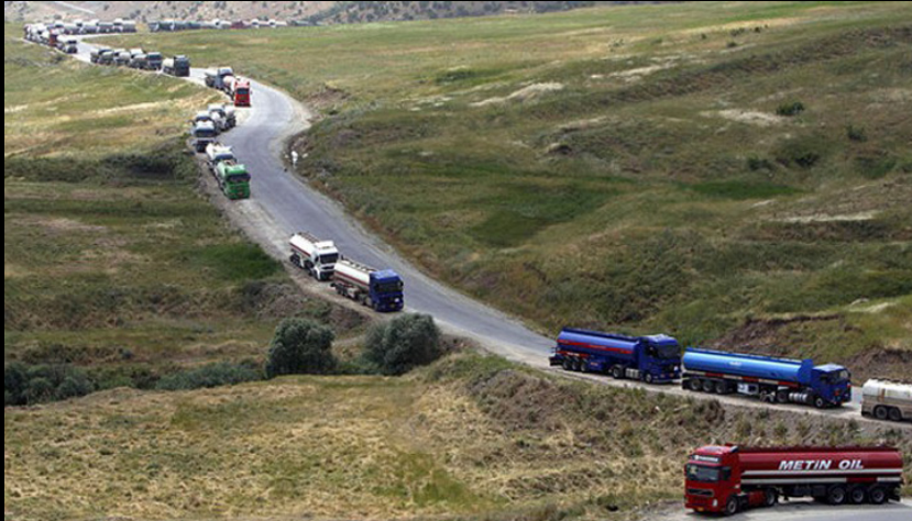
Bilden visar en kolonn med oljetransporter på väg mot den turkiska gränsen för vidare transport via turkiska hamnstäder

Innan gränsövergången möts transportererna av en oljemaffia, smugglång bestående av syriska och irakiska kurder, turkar och iranier. Konkurrensen mellan rivaliserande gäng är knivskarp och har lett till att mord blivit vardagsmat. Den person som ansvarar för respektive transport säljer oljan till högstbjudande gäng. Förra överlämna sina fordon till nya förare som bär tillstånd och papper att korsa gränsen till Turkiet med sin transport. I utbyte mottar de ursprungliga chaufförerna tomma tankbilar som går i retur till ISIS-kontrollerat område.