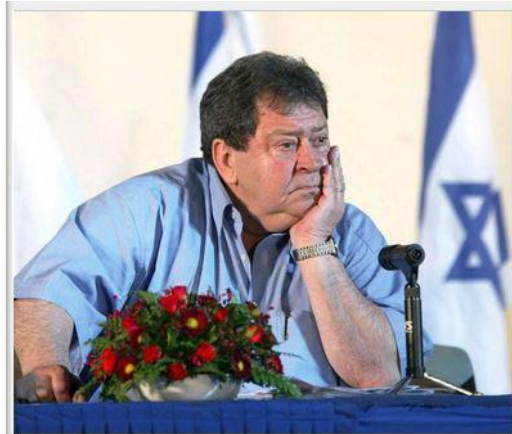
Binyamin Ben-Eliezer feel many Europeans are in danger of supporting a new Holocaust.