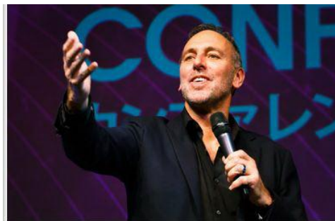
Brian Houston has left Biblical Christianity and present hallow storytelling mixed with New Age doctrines.